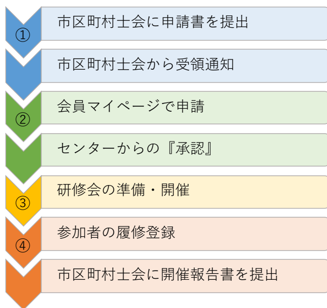
『承認』研修会 開催の流れ (大阪府理学療法士会生涯学習センター)